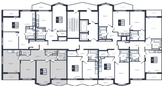
На плане этажа

Особенности • 2 лоджии • 2 окна в кухне-столовой • Гардероб • Раздельный с/у • Эркер